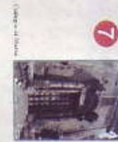
Chiesa di S. Maria