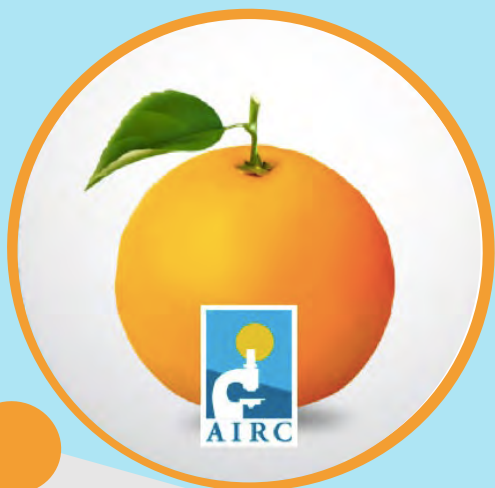
LE ARANCE DELLA SALUTE ultimo sabato di gennaio

Accanto alle iniziative locali di raccolta fondi, tre sono le manifestazioni nazionali per AIRC