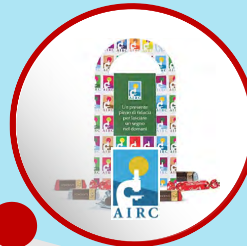
I CIOCCOLATINI DELLA RICERCA primo week end di novembre