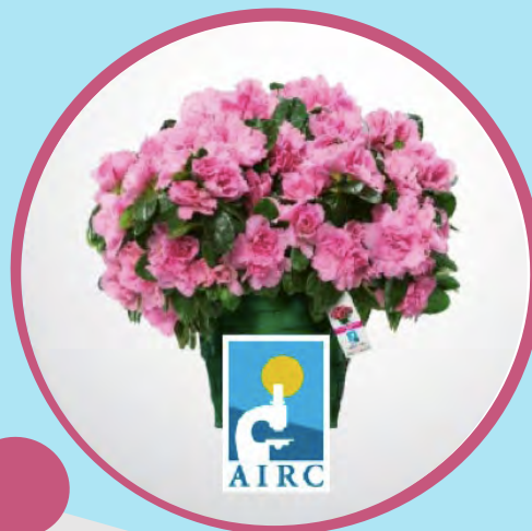
L'AZALEA DELLA RICERCA seconda domenica di maggio